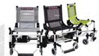
Disponible en color gris, negro y verde.